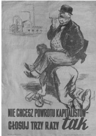
Nie chcesz powrotu kapitalistów - głosuj trzy razy tak, 1946 r. Między Związeki Niepodległościowych w Łodzi