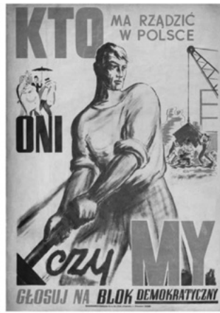
Kto ma rządzić w Polsce - oni czy my, 1946 r. Między Związeki Niepodległościowych w Łodzi