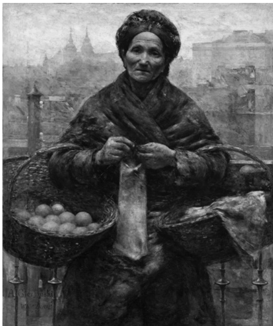
Żydówka z pomarańczami , Aleksander Gieryski (1850–1901), Muzeum Narodowe w Warszawie