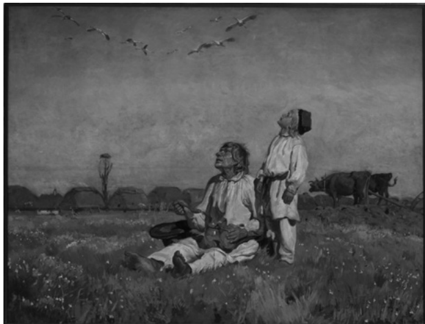
Bociany , Józef Chełmoński (1849–1914), Muzeum Narodowe w Warszawie (Wikimedia Commons)