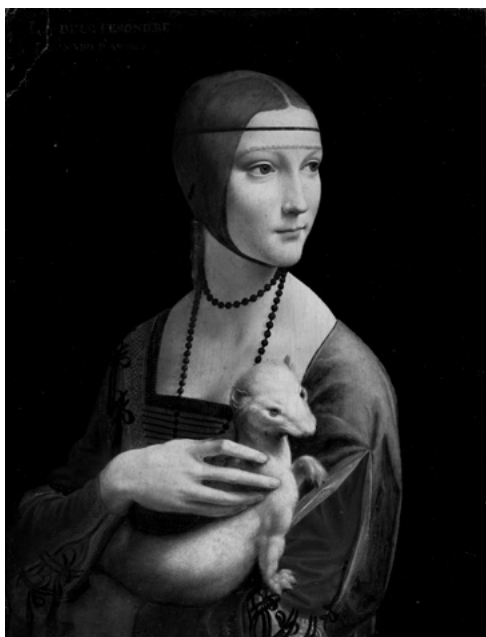
Dama z gronostajem , Leonardo da Vinci (1452–1519), Muzeum Czartoryskich