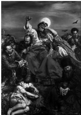
Wernyhora , Jan Matejko (1838–1893), Muzeum Narodowe w Krakowie