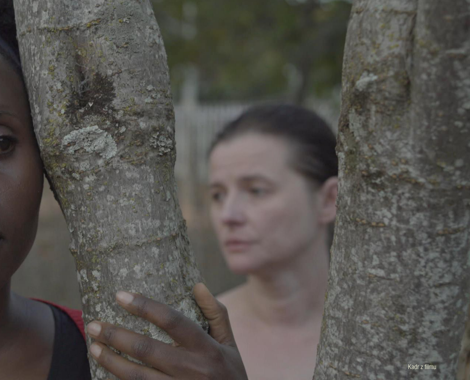
Kadr z filmu

nia w mieście. Od 1952 roku w Rwandzie funkcjonowała Rada Najwyższa, jako ciało doradcze przy królu, a od 1956 roku Naczelna Rada Kraju – pierwszy parlament pochodzący z wyborów, zdominowany przez Tutsi. W 1953 roku monarcha Rwandy pierwszy raz zapelował do Belgii i ONZ o niepodległość dla swojego kraju. Taki postulat zaskoczył Belgów, postanowiono stopniowo przenosić poparcie na Hutu. W Brukseli mówiono, że to pozwoli zaprowadzić w Rwandzie demokrację. Misjonarze katolicki zaczęli edukować Hutu, zaskarbiając sobie ich sympatię.